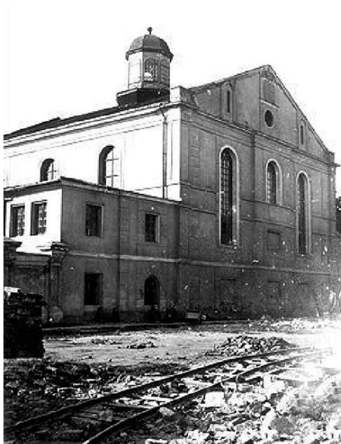
Bożnica żydowska. Fotografia z 1940 roku.