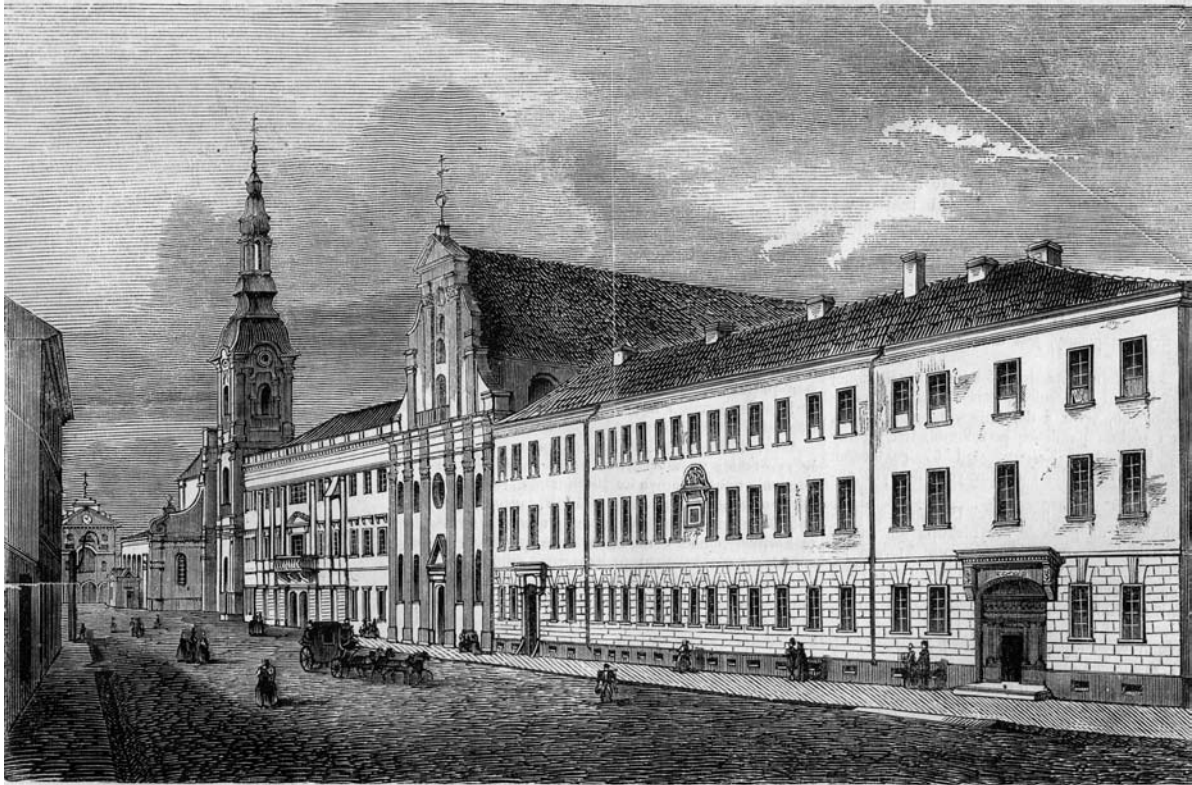
Kościół Świętego Józefa oraz kościół ewangelicki ob. garnizonowy w Kaliszu.

wbrew woli ojca zakochała się w szewcu Marcinku. Ojciec zagniewany na córkę, rozkazał ją zamurować w baszcie, w której dziewczyna niebawem zmarła z głodu. Jej wybranek spadł z murów podczas ucieczki przed strażą zamkową. W niektóre dni podobno słychać nawoływania zakochanych 16 .