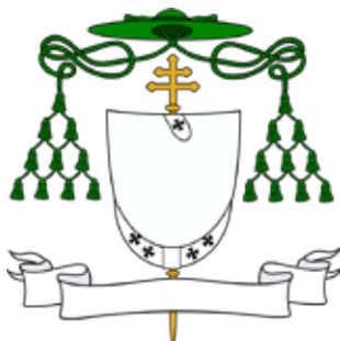
Herb arcybiskupa (wersja z paliuszem)