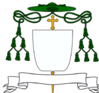
Herb biskupa ordynariusza lub sufragana