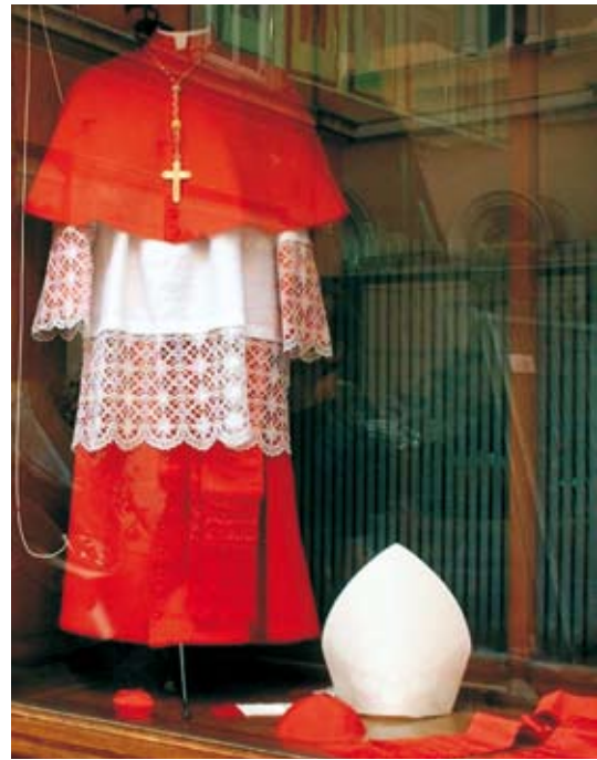
Szaty kardynalskie.

Kardynał, który jest patriarchą 14 wschodnim otrzymuje automatycznie godność kardynała-biskupa, przy czym zachowuje jako tytuł swój kościół patriarchalny. Każdy nowo mianowany kardynał podczas mszy św. w bazylice św. Piotra w Rzymie otrzymuje od papieża pierścień oznaczający związek ze Stolicą Apostolską oraz czerwony biret 15 , który jest symbolem oddania się