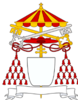
Herb Kamerlinga Kolegium Kardynalskiego