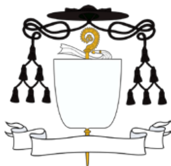
Herb opata lub prepozyta infułata