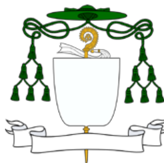
Herb opata i prałata niezależnego (NULLIUS)