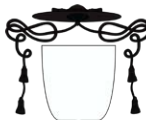
Herb dziekana, przeora, archiprezbitera lub przełożonego domu zakonnego