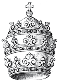
Tiara – pontyfikalne nakrycie głowy papieża