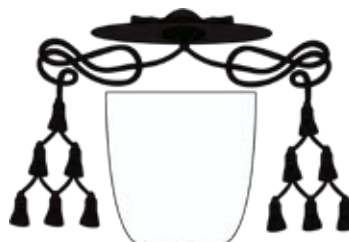
Herb generała zakonu