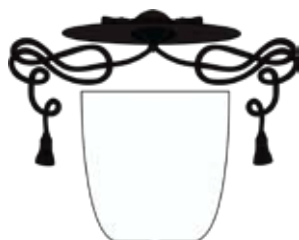
Herb kapłana nie posiadającego godności honorowych